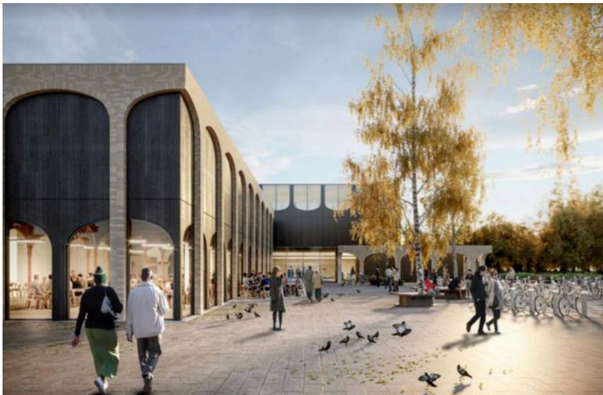
Nieuw multifunctioneel Sportcentrum in Ermelo

8.5 We willen niet bezuinigen op cultuur, maar zetten het geld zo effectief mogelijk in. Zo bereiken we zoveel mogelijk inwoners. Van culturele instellingen verwachten we dat ze verantwoordelijkheid afleggen over hoe zij subsidiegelden besteden.